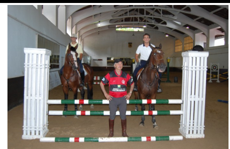
O extraordinário cavaleiro e instrutor, Nelson Pessoa, que dará seu nome ao Troféu Anual

"Instrutor do Ano" é um novo Premio instituído pela FEERJ e que identificará os mais bem sucedidos instrutores de equitação nas categorias de Base ( Mini Mirins a Juniors ), Jovens Cavaleiros e Amadores. Nas competições válidas para o RANKING FEERJ 2014 serão pontuados os Instrutores com alunos nessas categorias, com seus respectivos nomes constando obrigatoriamente das Ordens de Entrada . Essa informação será fornecida pelo próprio competidor, quando da inscrição on - line, que só será efetivada após preenchimento do campo correspondente. A PONTUAÇÃO dar-se-á por prova, com os Instrutores acumulando seus pontos. Será adotado o seguinte critério: PONTOS de CLASSIFICAÇÃO - 12 pts ao 1º lugar, 9 pts ao 2º lugar, 7pts ao 3º lugar, 6 pts ao 4º lugar, 5 pts ao 5º lugar, 4 pts. ao 6º lugar e PONTOS de PARTICIPAÇÃO - 1pt. por conjunto inscrito . Todos os pontos ( Classificação & Participação) são cumulativos, não havendo descartes. Ao final de cada Etapa do RANKING FEERJ 2014, nosso site informará das pontuações dos instrutores de equitação fluminenses. Em algumas Etapas, poderão ser instituídos PREMIOS ESPECIAIS, como nesta, por exemplo.